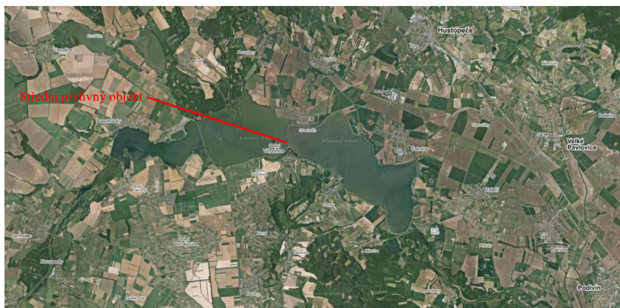
Letecký snímek s označením středního přelivu